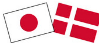
Japan - 150 years - Denmark

Dykon har i forbindelse med 150 års jubilæet udviklet en hel unik dyne, for at markere samarbejdet mellem Japan og Danmark. Herudover har de blandt andet mærkerne Ringsted Dun og EngmoDun med på messen.